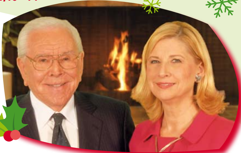
Robert Schuller Dr. Robert H. Schuller